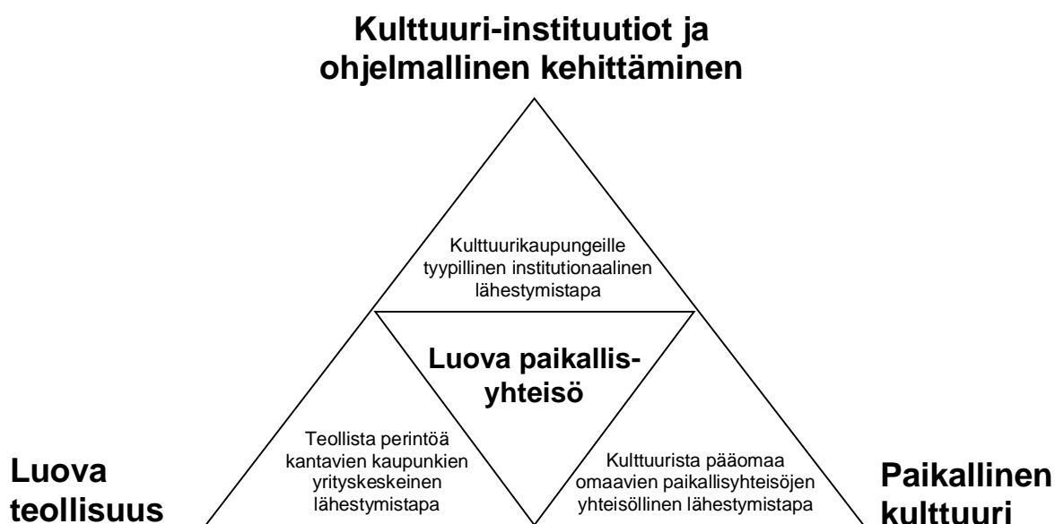
Kuvio 4.1. Luovan kaupungin elinkeinopoliittisia painopistealueita.

Edellä esitetty jaottelu viittaa epäsuorasti siihen, että kunnilla ja alueilla on hyvin erilaiset lähtökohdat luovan kaupungin kehittämisessä, jos asiaa tarkastellaan nimenomaan elinkeinopoliittiselta kannalta. Näitä ehtoja voidaan kutsua luovan yhdyskuntakehittämisen rakenteellisiksi